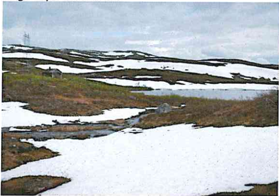
1.Juli ved Finntjønnhytta

Det ble en sen vår med masse snø og is i fjellet til langt utpå sommeren.