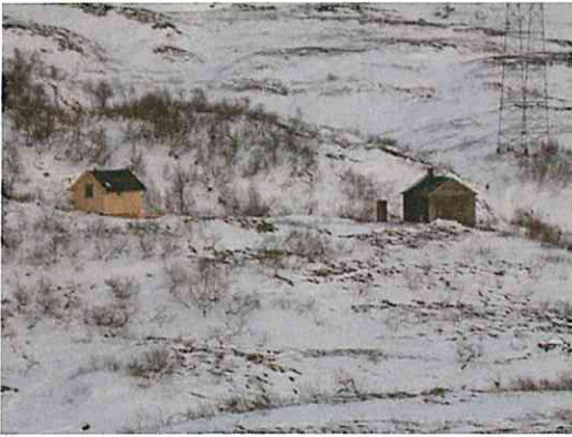
Finntjønnhytta med nødbu.