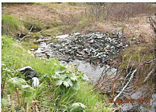
Søppel ved skogsbilvei.