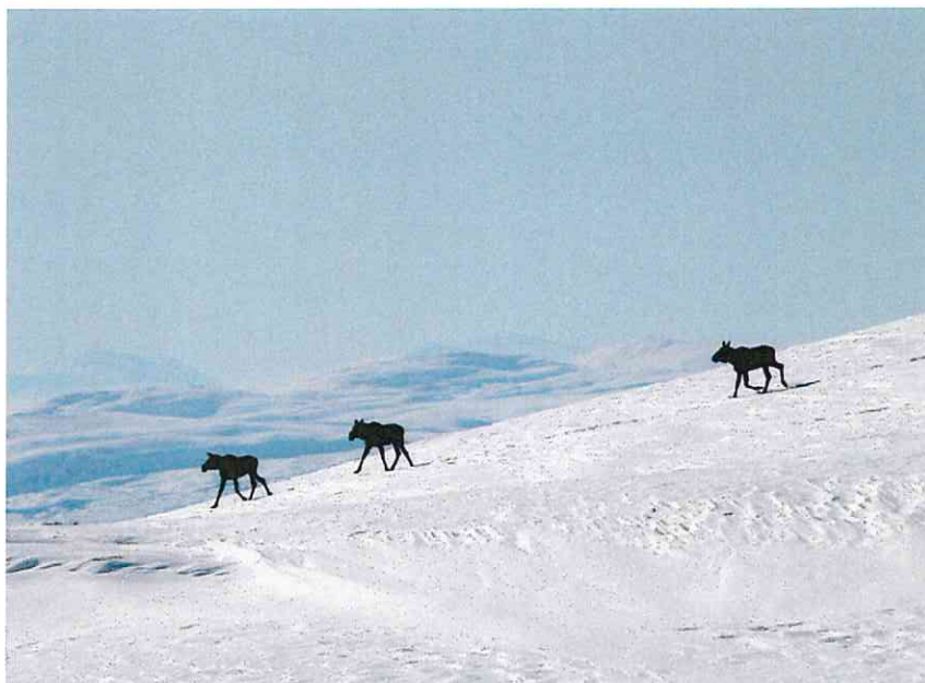
Elg på vandring over Gisen