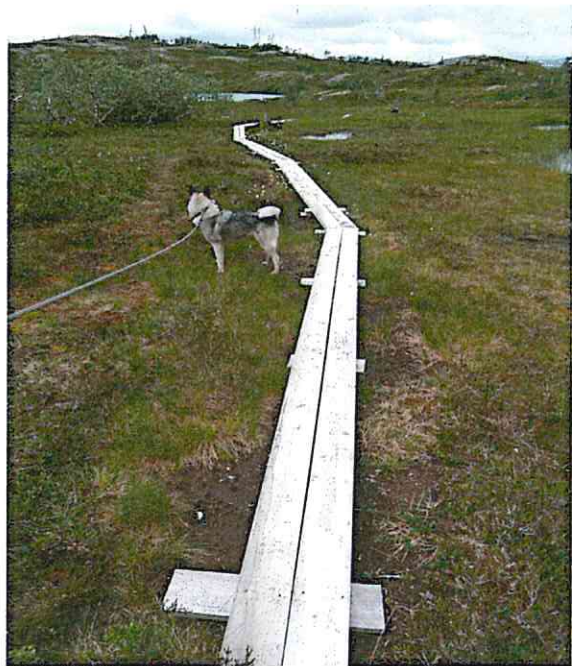
Klopplagte myromr Smalfjellet

Arbeidet skal utføres i 2013 og fjellstyret har fått kr 44.000,- + mva for jobben.