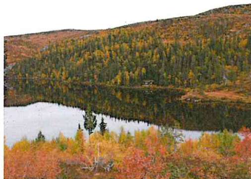
Høst ved Stordalsvatnet.

posten har imidlertid ikke på noe vis fulgt lønns- og kostnadsutviklingen i samfunnet og refusjonen er derfor langt under det som loven tilsier. For 2012 har vi bokført kr 1.172.850,- i refusjonsberettigede kostnader. Dette skulle gitt kr 586.425,- i refusjonsmidler. I praksis fikk vi utbetalt kr 284.000,-.