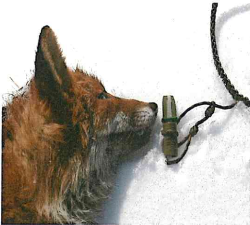
Rev felt etter lokking.

Fjellstyret innførte også et småroviltkort som dekker jakt på kun smårovilt. Kortet koster kr 10,-.