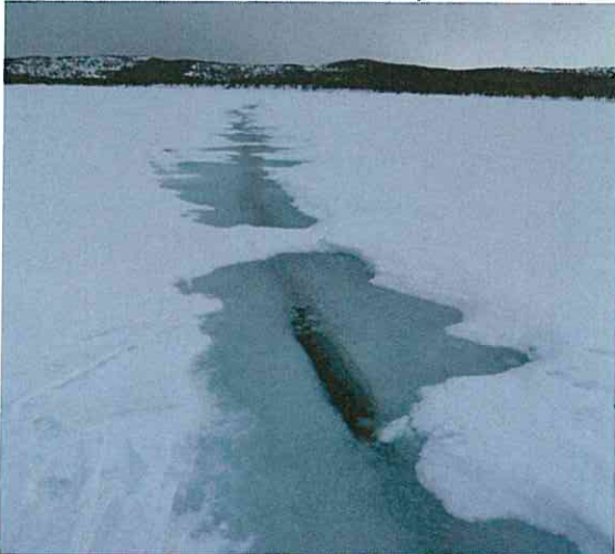
Sprekk i isen på Mellingsv.

Vinteren 2012 ble en vinter med masse laussnø og vanskelige føreforhold til langt utpå vinteren. Også i år var det tendens til overvatn og vanskelige føreforhold på elver og vann, men det kom seg mot slutten av påsken. Høg vannstand i mars førte til at isene fløt opp en periode. Det førte til at isen bl.a. på Mellingsvatnet revnet og i månedsskiftet mars/april var det ganske store sprekker i isen.