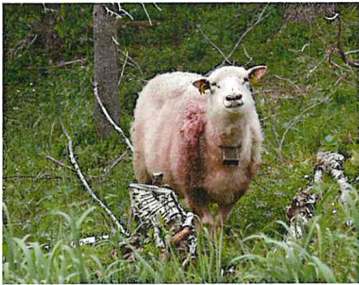
Sau kvestet av bjørn. Ble avlivet.

Alle statsallmenningene blir også benyttet til tamreindrift, hovedsakelig i perioden 15/4-31/12. De fleste driftsenheter for rein har sitt vinterbeite nærmere kysten.