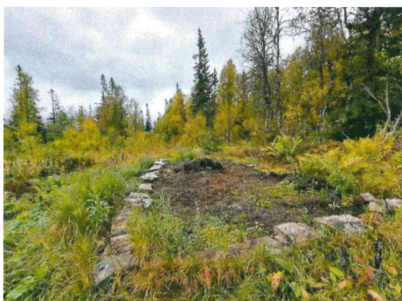
Den gamle Tromsdalshytte er nå historie.

Prosjektet med ny Tromsdalshytte inkl riving av den gamle er nå helt avsluttet. Alle rester etter den gamle hytta er nå borte.