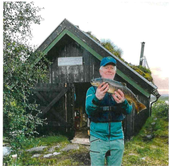
En heldig fisker med ørret tatt i Lissgåsvatnet i 2022.

Brutto omsetning for Namsskogankortet endte på kr 265.520,- noe som er en nedgang på over 20 % fra året før. En kald og regntung sommer får ta noe av skylden for dette.