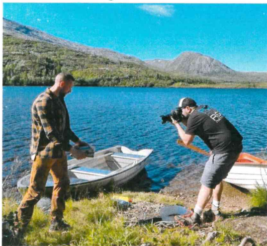
Fotodag med Visit Namdalen august 2022.

I august kom Visit Namdalen til oss for å ha en dag med fotografering med egen stylist og profesjonelle statister. Som takk for hjelpa denne dagen kan fjellstyret benytte bildene i sin markedsføring.