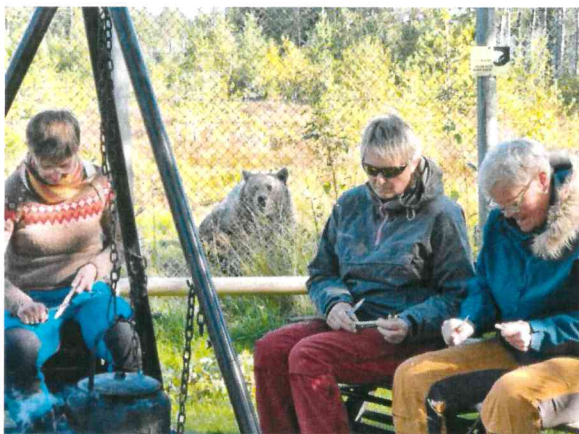
Familieparken har utmerkede kurslokaler.

Samarbeidet med Trondheimregionens Friluftsråd, Besøksenter Rovdyr i Namsskogan og Nasjonalt Villakssenter i Namsos fortsatte i 2022. Det ble arrangert et kurs «Læring i friluft» for ansatte i skoler, SFO og barnehager. Deltakere fra Bindal, Stjørdal og Namsos var med på kurset med Namsskogan Familiepark og rovdycampen som fasilitet.