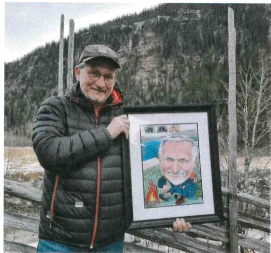
Reidar ble takket av i 2022...

Regnskapstjenester er kjøpt hos Bakkan Regnskap AS. Revisjon Midt-Norge har vært oppdragsansvarlig revisor.